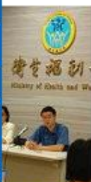
福利部召開記者會